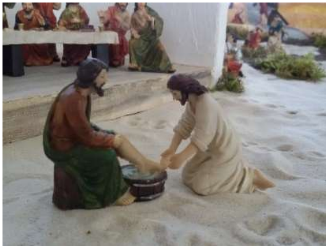
Ausschnitt aus der Passionskrippe in Mariä Himmelfahrt

Mariä Himmelfahrt und jeden Samstag vor der Hl. Messe in Mariä Himmelfahrt um 17.00 Uhr ist Beichtmöglichkeit. (Bitte die Gottesdienstorte in der Gottesdienstordnung beachten. In der Regel ist der Samstagabend-Gottesdienst alle zwei Wochen in Mariä Himmelfahrt.)